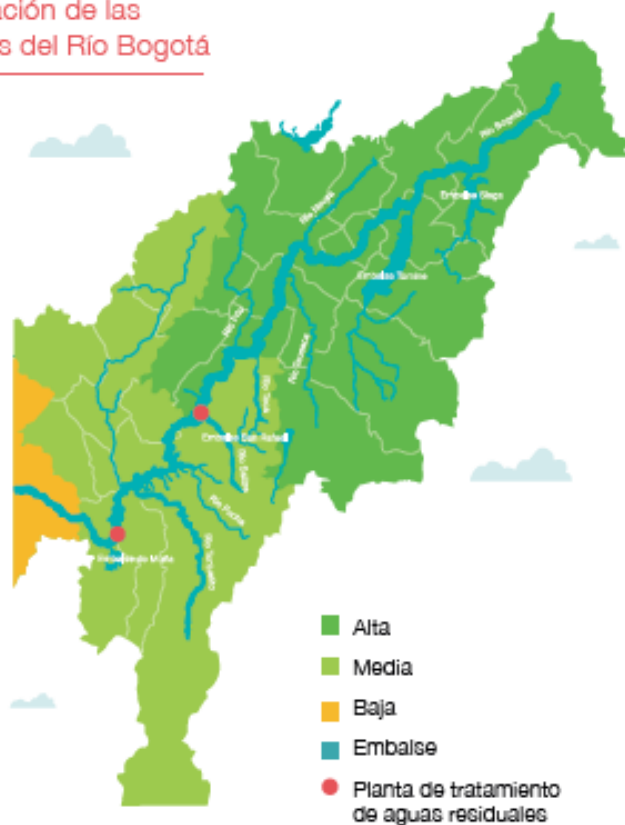
Zonificación de las cuencas del Río Bogotá